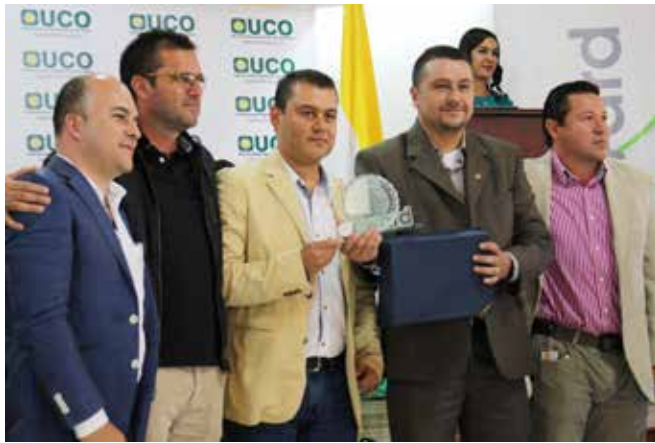
La Nueva Energía Paisa en la bienal de autoridades y gestores públicos, auditorio Flavio Calle Zapata.

sores del Congreso, líderes políticos de Colombia y de siete países más, estos son: Costa Rica, Ecuador, Perú, Argentina, España, Bolivia y Panamá, se reunieron en la uco durante una jornada académica intensa que arrojó un aporte manifiesto, en el cual se trazó la ruta a seguir en temas de desarrollo territorial.