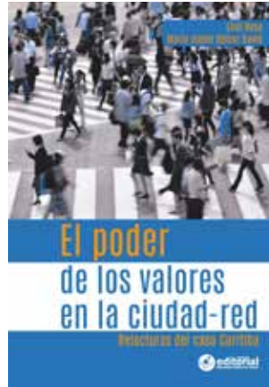
El poder de los valores en la ciudad-red. Relecturas del caso Curitiba (2016).