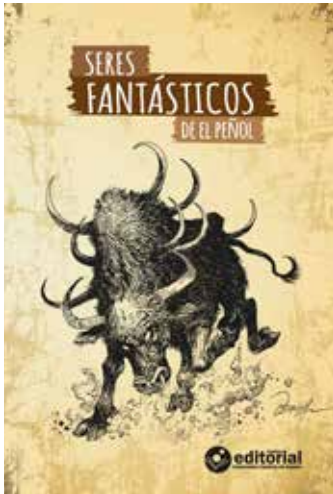
Lanzamiento del libro Seres fantásticos de El Peñol (2015) en el marco de la Fiesta del Libro y la Cultura de Medellín, año 2016.