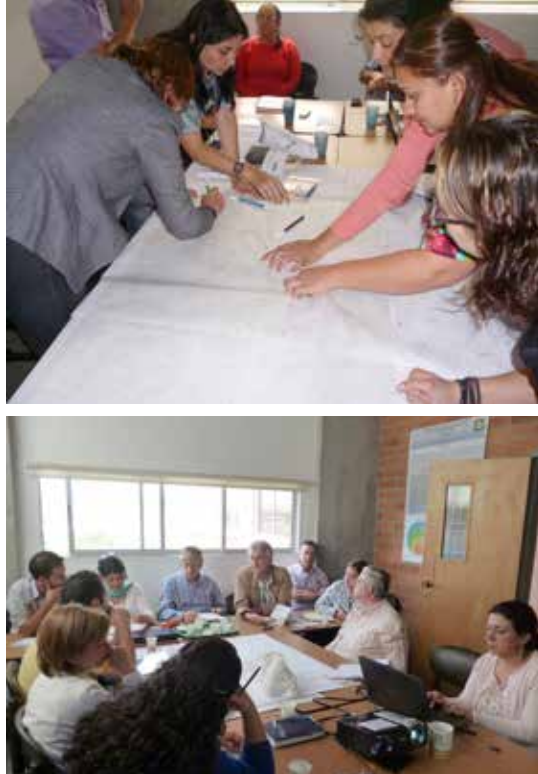
Sala de juntas edificio de la Ciencia. Primer equipo técnico del CET, septiembre de 2012.

Para la formulación de los PBOE de los tres municipios mencionados, el CET partió de una metodología basada en la participación ciudadana, el mapa de actores, la consulta a comunidades y grupos organizados, además de incluir todas las voces posibles, pues inmediatamente se asumió que todo lo relacionado con el territorio se mantiene, persiste y dura si se genera corresponsabilidad y articulación entre comunidad e institucionalidad. Por consiguiente, se desplegó un trabajo de medios para acercarnos a la gente; así mismo se hizo un diagnóstico en el que se identificaron las necesidades, intereses y