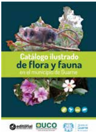
Y en el 2018 hubo otra aventura editorial, con la aparición del Catálogo ilustrado de flora y fauna en el municipio de Guarne.

En el mismo 2016 la uco participó por primera vez en la Fiesta del Libro y la Cultura de Medellín, presentando sus libros gracias a la gestión adelantada por el CET.