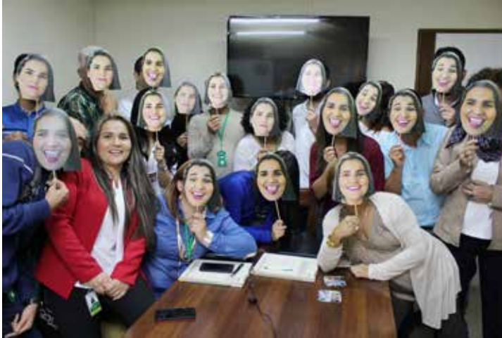
Celebración del Día de la Secretaria, reconocimiento a la labor ejemplar de uno de los miembros del equipo.

El Concilio Vaticano II, por medio de la constitución pastoral Gaudium et spes , capítulo primero, indica: