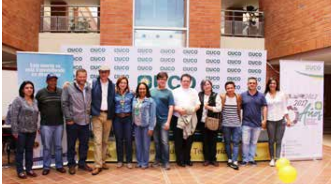
Integrantes e invitados a la Maratón radial, 2017.

Hacer un ejercicio de comunicación para el desarrollo del territorio motivó al equipo del CET a avanzar en la propuesta, considerando que la maratón sería respaldada por las emisoras comunitarias, cuyo rol era informar sobre los avances de los planes de desarrollo y las dificultades propias de una gestión que debe ser transparente y concertada con las comunidades. Las emisoras estaban afiliadas a la Asociación de Emisoras en Red de Antioquia (Asenred).