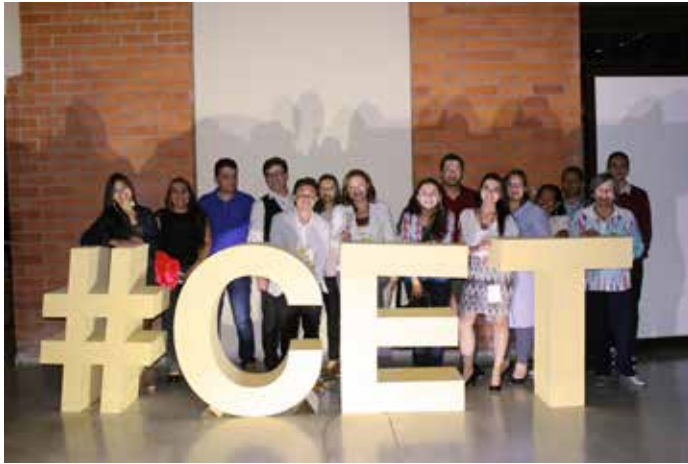
Celebración de los cinco años del CET, plazoleta Madre de la Sabiduría.

Es necesario decir que los aliados internacionales festejaron estas construcciones y felicitaron al CET por lo logrado en tan poco tiempo, sobre todo, por la claridad metodológica y conceptual con que se venían haciendo las intervenciones.