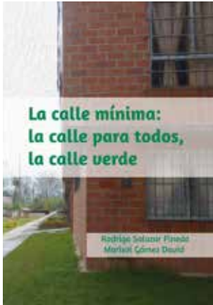
La calle mínima: la calle para todos, la calle verde (2014).