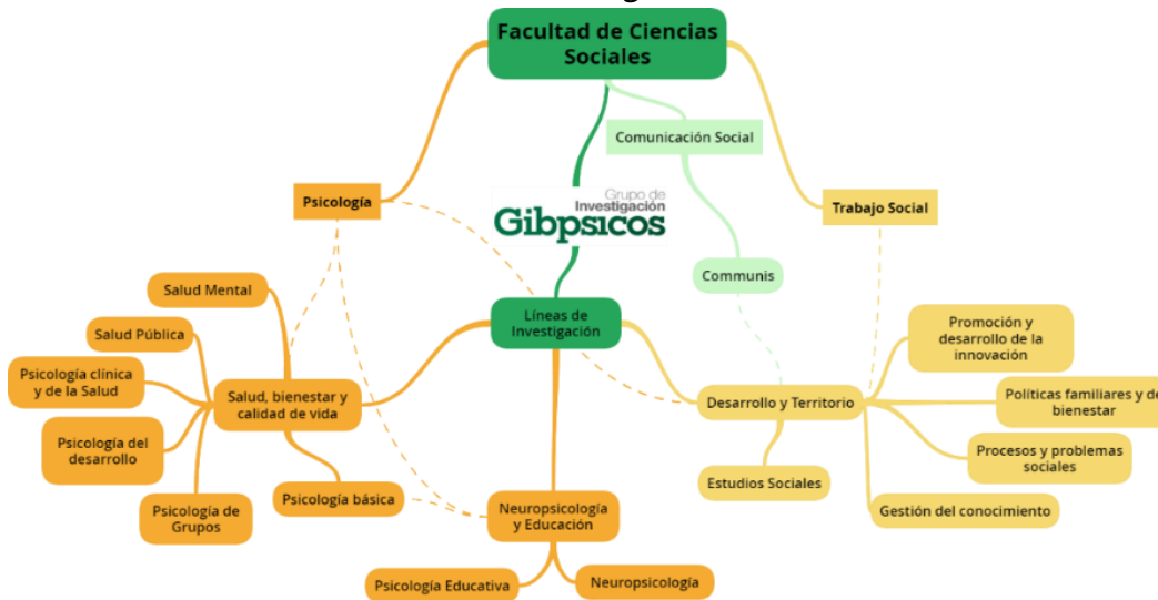
Gráfica 2. Líneas de investigación de GIBPSICOS